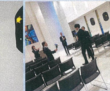
直前打合せもばっちり!