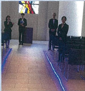
チャペルも滑走路や飛行機をイメージした内装に...