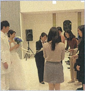
ブーケはどなたに?!