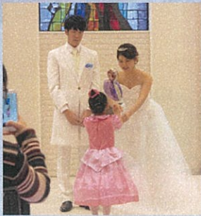
指輪を届けてくれた女の子♪