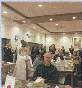
学生のドリンクサービスも板についてます★