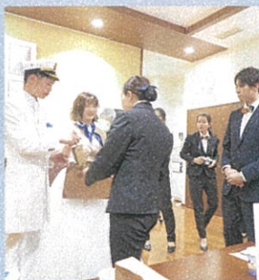
パイロットとCAになってプレゼントをお配りしたり、1年生と記念撮影も♪