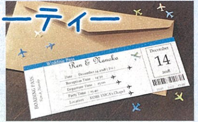
招待状もエアチケット風

2018年12月にホテル学科2年生の卒業制作「模擬ウェディング&披露パーティー」が、神戸YMCAのチャペルとレストランにて執り行われました。今年は、結婚式とパーティの2部構成で、学生たちも2組に分かれて作り上げていきました。アテンド、司会、受付などすべて学生が担い、飛行機で旅立つイメージで一貫したデザインと演出で、おしゃれで楽しい模擬ウェディング&披露パーティーとなりました。その様子を紹介いたします。