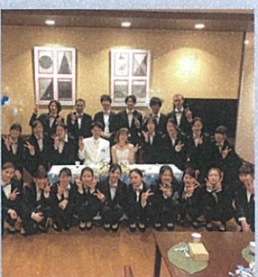
素敵な結婚式で暖かい拍手をいただきました。