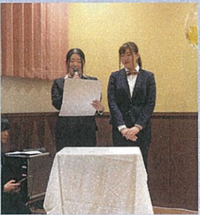
搭乗案内風の司会で披露パーティー、スタートです